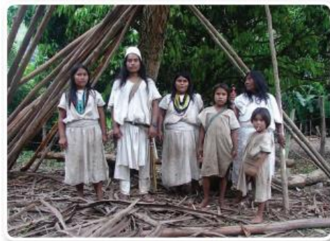
Los indígenas Arhuacos de la Sierra Nevada de Santa Marta han conservado su cultura a través de los siglos.